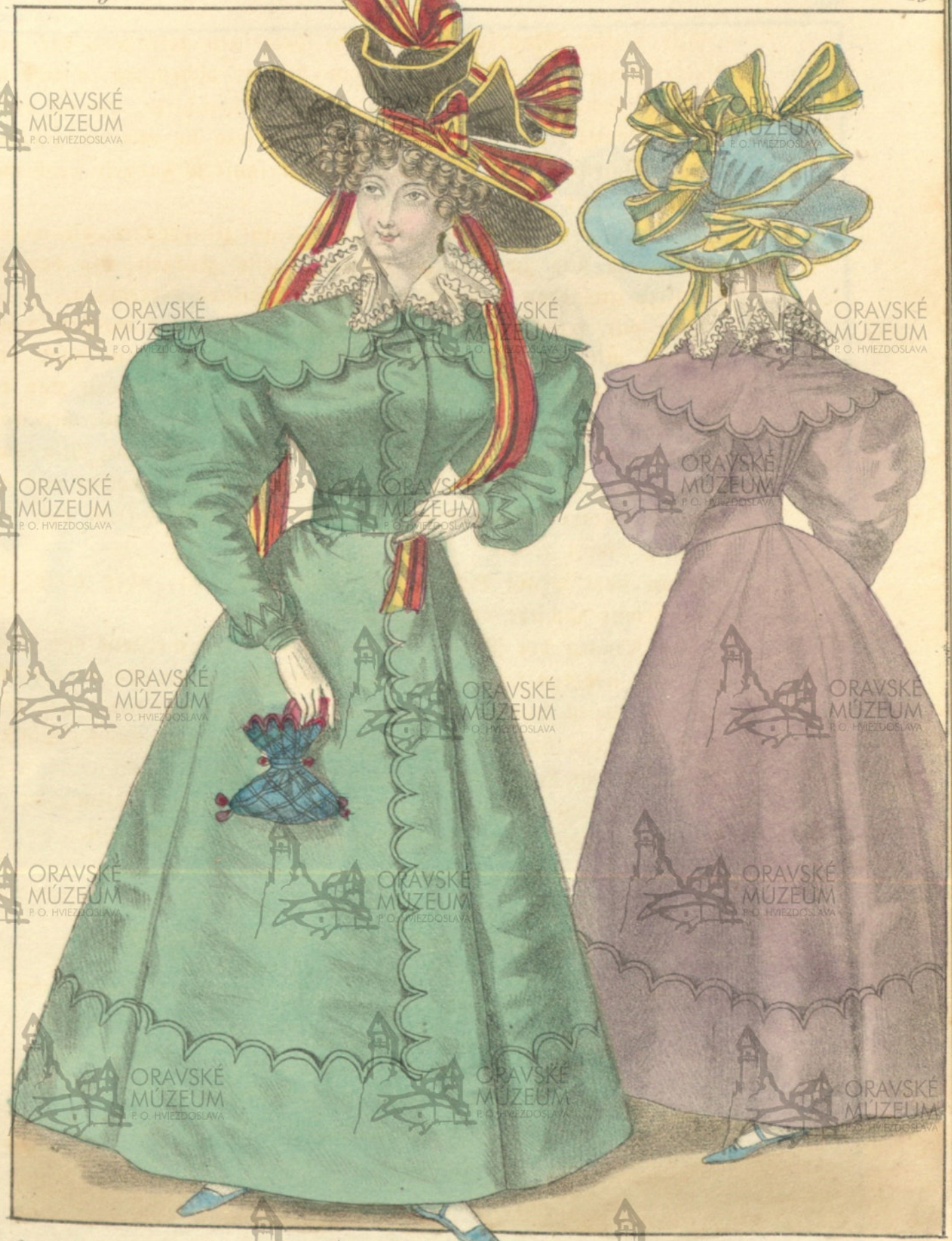
Capothut von Gros de Naples mit Bänderchen. Ueberrock von Gros de Naples mit feston.